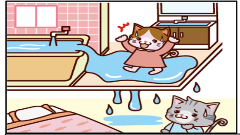
うっかり水を出しっぱなしにして階下に損害を与えた