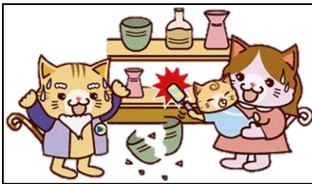
人のものを壊した