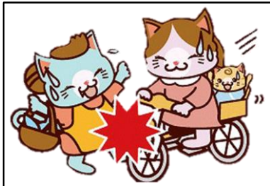
自転車でぶつかった